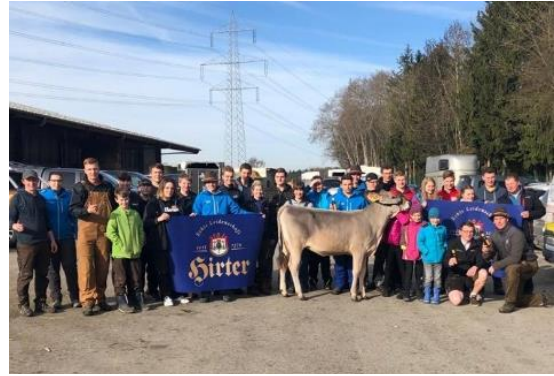
Unser Erfolgsteam am BJC in Wieselburg

24 motivierte und engagierte Teilnehmer aus Kärnten und ein toller Fanclub als Unterstützung komplettierten unser Team in Wieselburg. Wir gratulieren all unseren Jungzüchtern recht herzlich zur erfolgreichen Teilnahme am diesjährigen BJC und möchten uns bei allen Teilnehmern, Helfern aber auch bei unseren Sponsoren kärntnerrind, Hostein Kärnten und der Hirter Brauerei recht herzlich für ihre Unterstützung bedanken.