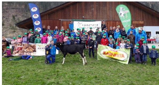
Auf verschiedenen Stationen konnten über 70 Kinder mehr über die Jungzüchterarbeit erfahren

Der Jungzüchter-Nachwuchs im Bezirk Hermagor ist gesichert – und das im wahrsten Sinne des Wortes! Mit über 70 Kindern haben wir am 13. April 2019 bei der Betriebsgemeinschaft Oberressl in St. Lorenzen/Gitschtal erstmalig den Bambinitag im Bezirk Hermagor abgehalten. Im Stationenbetrieb versuchten wir den zahlreichen Kindern die Jungzüchterarbeit näher zu bringen und möglichst praxisnah zu erklären. Bei allen begeisterten Kindern und ihren Eltern bedanken wir uns fürs Kommen, aber auch allen Jungzüchtern danken wir fürs Mithelfen. Ihr alle habt zu einem reibungslosen Ablauf und zu einer gelungenen, für uns alle lustigen Veranstaltung beigetragen. Ein weiteres Dankeschön gilt natürlich auch der Betriebsgemeinschaft Oberressl für die zur Verfügungstellung des Betriebsgeländes, sowie unseren Sponsoren Kärntnermilch, Kanerta und der Bäckerei Moritz. Vielen Dank fürs Dabeisein und wir freuen uns schon sehr auf die nächsten Bambinitage im Herbst.