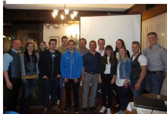
Der neu gewählte Vorstand freute sich über das Kommen der Ehrengäste.