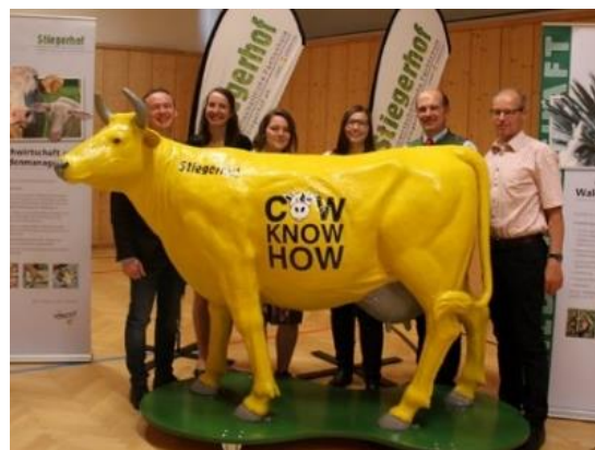
Jungzüchter hinter dem „CowKnowHow-Maskottchen“ bei der Projektpräsentation am Stiegerhof

Besonders stolz sind wir Teil des Projektes „CowKnowHow“, das von der LFS Stiegerhof entwickelt wurde, zu sein. Das Ziel dieses Projektes ist es, anhand von Kurzfilmen verschiedene Tätigkeitsbereiche der Landwirtschaft zu erklären und wertungsfrei darzustellen. Unter der Homepage www.cowknowhow.at sind bis jetzt vier Kurzfilme verfügbar. Ein Blick darauf lohnt sich für Euch alle! Auch unser Verein wird bei den Videoreharbeiten mitwirken und wir sind stolz, Projektpartner von CowKnowHow zu sein!