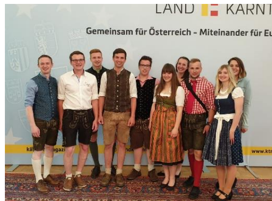
Eine kleine Abordnung der Kärntner Jungzüchter repräsentierte den Verein bei der Tierschutzpreisverleihung im Spiegelsaal.