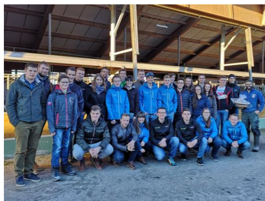
Gruppenfoto nach der Betriebsbesichtigung am Braunviehzuchtbetrieb Babel im Ostallgäu

Auch im nächsten Jahr wollen wir wieder einen gemeinsamen Ausflug machen. Diesmal soll es von 14. bis 16. Feber 2020 nach Südtirol gehen.