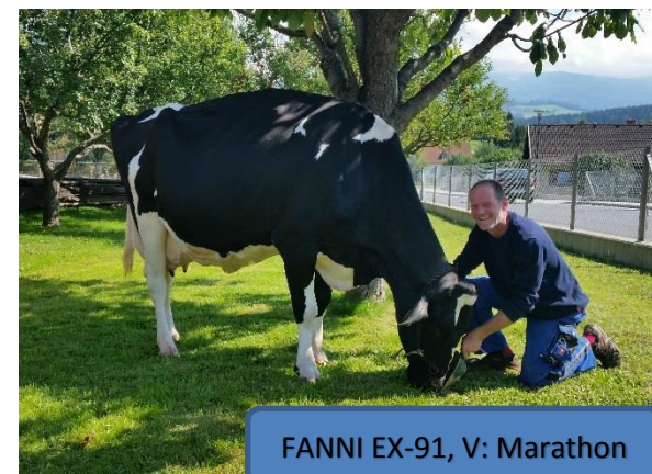
FANNI EX-91, V: Marathon