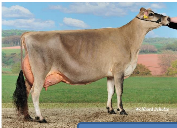
SENTA EX-90, V: Q Zik