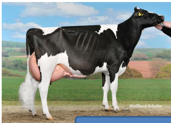
BOUNTY EX-90, V: Lheros